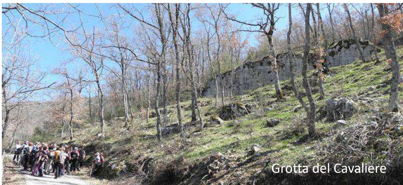
Grotta del Cavaliere

L'anello escursionistico da S. Elpidio a S. Elpidio comprende la visita di siti con resti di mura poligonali (ciclopiche o pelasgiche), conosciute con i nomi di Grotta del Cavaliere, S. Lucia vicino a Collemaggiore e Colle Vetere. Accompagnerà i partecipanti l'archeologo Paolo Camerieri. Prima della partenza (ore 9.00) e dopo l'arrivo (ore 16.00) i partecipanti potranno visitare un estratto della mostra "Una nuova stagione per l'Appennino centrale", un territorio tra memoria e futuro , allestita all'interno della palestra dell'Edificio scolastico di S. Elpidio, cortesemente concessa dall'Istituto Comprensivo Statale "Giovanni XXIII" di Petrella Salto.